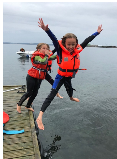
Deltakere på PLASK hopper i havet!

De siste ukene har det foregått mye på vedlikeholdsfronten her på Laberget. Mye er i god stand på leirstedet, men et hus som nærmer seg sine 50 år trenger stadig vedlikehold og oppgraderinger. De siste ukene har kyndige snekkere sørget for både skifte av vinduer, etterisolering og ny kledning på jentefløya, ny kledning rundt yttertaket på møtesalen og en ny yttervegg med nye vinduer på Bergstua – hytta nede ved sjøen. Med ny kledning trengs også ny maling! Flere dager i høst har vi derfor fått god dugnadshjelp med maling utendørs. Tusen takk for bidraget!